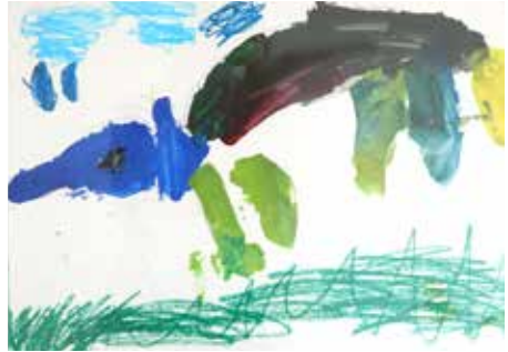
변우준 <Animal 'Elephant'>