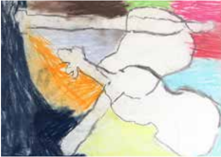
장지우 <Picasso Still-Life Violin>

2018년 시작된 재능계발 프로젝트 ‘반얀트리 Big Canvass by YSA’의 첫 번째 전시회가 지난 달 2일부터 16일까지 클럽동 로비에서 열렸습니다. 어린이 작가들의 섬세한 감성이 녹아 들어간 다양한 작품들을 감상할 수 있는 뜻깊은 시간이었습니다.