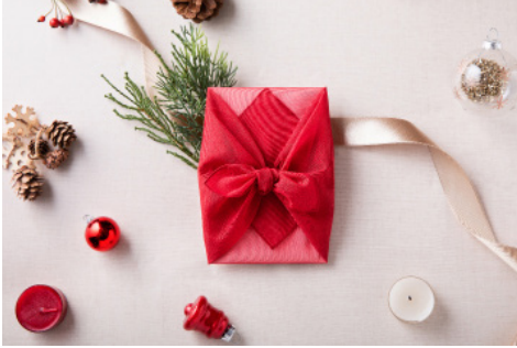
*상기 이미지는 실제 포장 이미지입니다.

반얀트리 스파는 크리스마스를 맞아 시즌 한정 특별 포장을 선보입니다. 12월 한 달 간 스파 바우처를 구매하시면 크리스마스 에디션 포장으로 사랑을 담아 정성껏 준비해 드립니다. 지친 영혼을 위한 안식처, 반얀트리 스파의 바디 마사지 바우처로 소중한 분들께 진정한 휴식의 시간을 선물하세요.