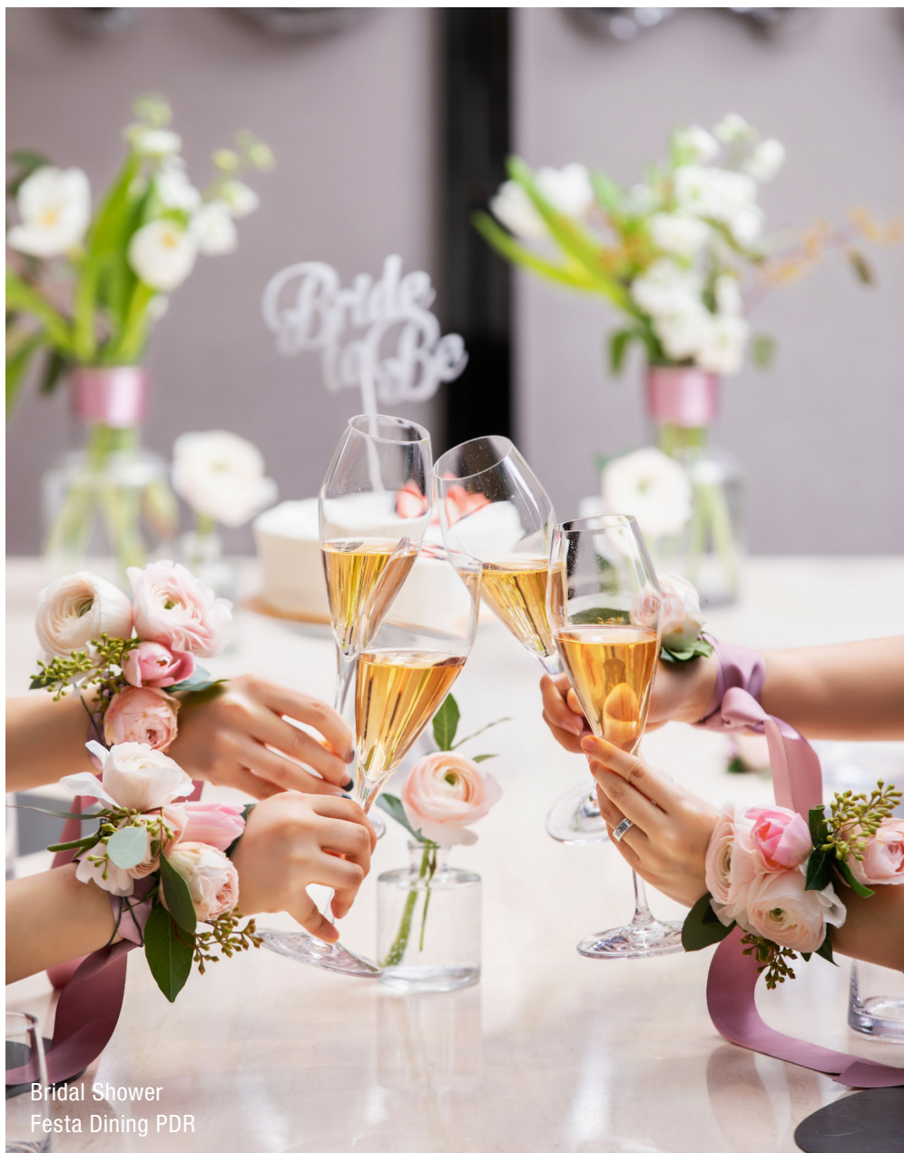
Bridal Shower Festa Dining PDR